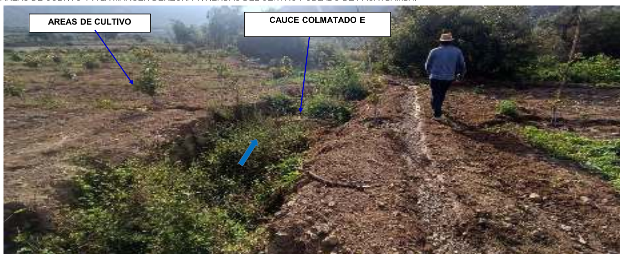
FIGURA N°04: A LA SALIDA DE LA QUEBRADA SIN DIQUES, SE ENCUENTRA UN CANAL DE RIEGO RUSTICO Y ÁREAS DE CULTIVO QUE SERIAN AFECTADOS EN ÉPOCA DE AVENIDAS.