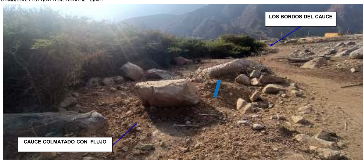
FIGURA N°02: CAUCE COLMATADO CON MATERIAL DE FLUJO DE DETRITOS, CON BORDOS EN AMBOS LADOS CASI INEXISTENTES; AGUAS ABAJO EN AMBOS LADOS SE ENCUENTRA AREAS DE CULTIVO, VIVIENDA Y TROCHAS CARROZABLES.