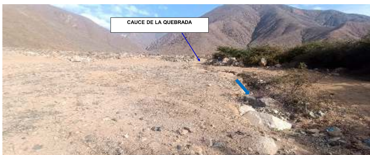
FIGURA N°01: UBICACION DE LA QUEBRADA QUE SE ENCUENTRA COLMATADO A LA ALTURA DEL CENTRO POBLADO PACAYBAMBA, DISTRITO DE SUMBILCA, PROVINCIA DE HUARAL - LIMA.