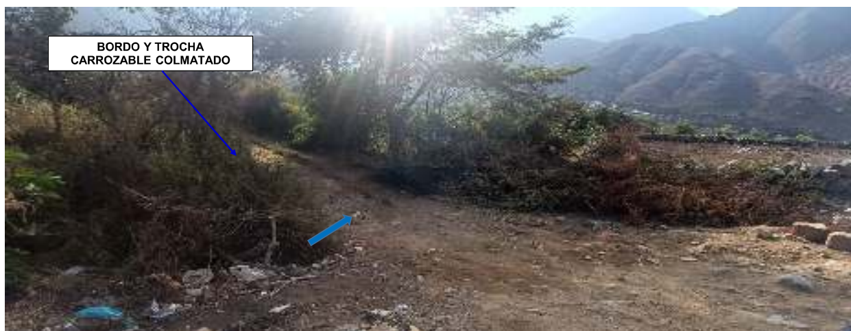
FIGURA N°03: TRAMO DE LA QUEBRADA SE ENCUENTRA COLMATADO CON MATERIAL FLUJO DE DETRITOS, EN LA MARGEN IZQUIERDA SE ENCUENTRA ÁREAS DE CULTIVO Y A LA MARGEN DERECHA VIVIENDAS DEL CENTRO POBLADO DE PACAYBAMBA.